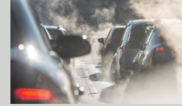
Yol kaynaklı kir tabakalarından / dumandan